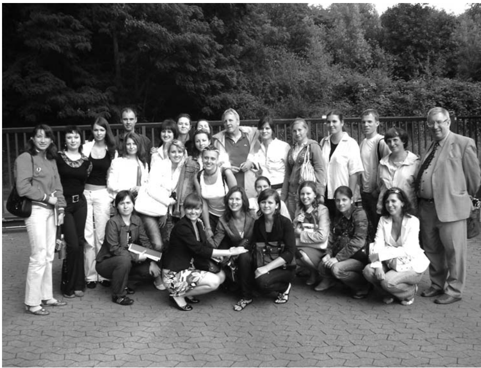
Группа практикантов и их руководителей в полном составе