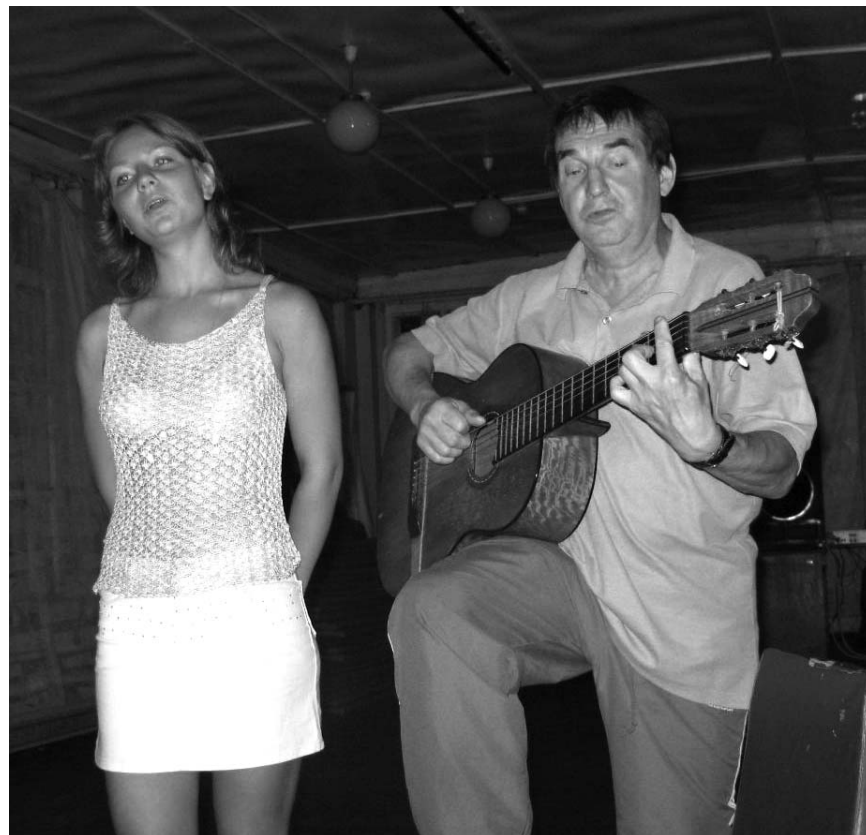
В СОЛ "Петушки" летом регулярно проходят концерты самодеятельности

Оле-Оле, Петушки! Что такое Петушки лучше не спрашивать. Нужно просто приехать и увидеть все своими глазами. Но обычно побывав там раз, люди приезжают туда каждый год. Отдых в лагере что-то вроде традиции.